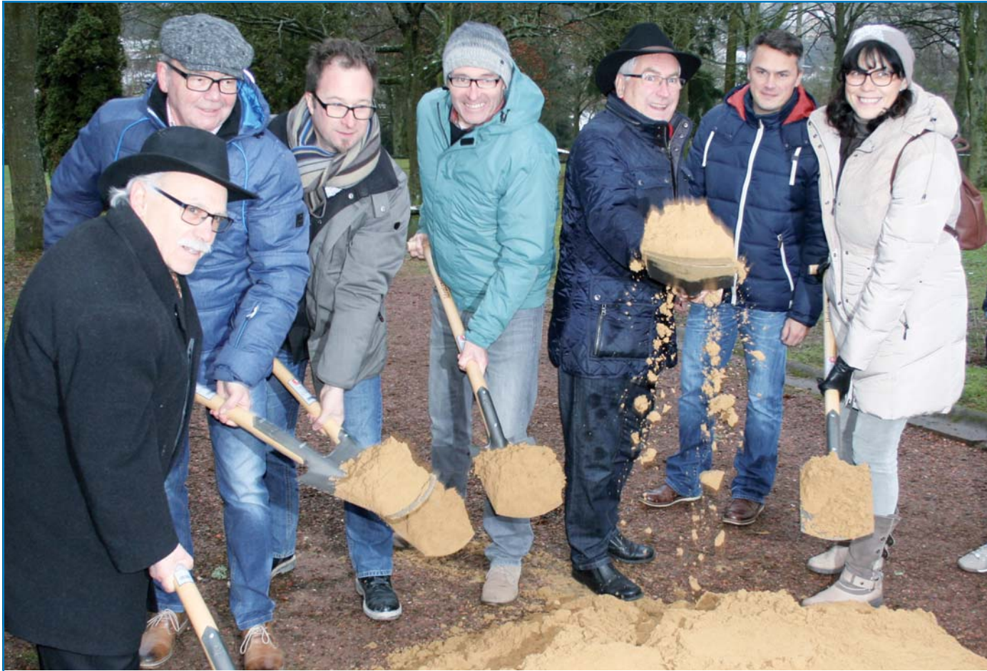
Gemeinsamer Spatenstich am Hugenottenfriedhof

Herausgeber: Stadt Völklingen Oberbürgermeister Klaus Lorig Redaktion, Gestaltung und Satz: Referat für Presse- und Öffentlichkeitsarbeit Stadt Völklingen Rathausplatz, 66333 Völklingen Für unverlangt eingesandte Artikel übernimmt die Redaktion keine Haftung.